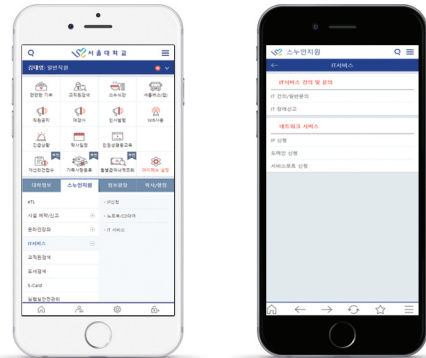
[모바일 플랫폼 제공]